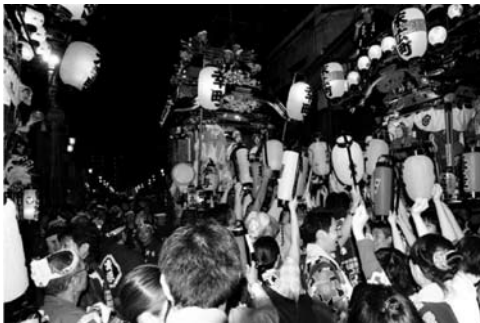
川越まつりの「曳っかわせ」

川越市は人口約35万人の市で、江戸時代には川越藩の城下町として栄え、別名「小江戸」と称されています。毎年10月には関東三大祭の一つの川越祭りが開催され、関東では数少ない山車の引き回しがあり多くの観光客が見物に来ます。又、名所も多く、時の鐘、川越一番街、菓子屋横丁、喜多院等多くを有しております。