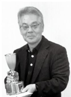
優勝トロフィーを手にした野々下様