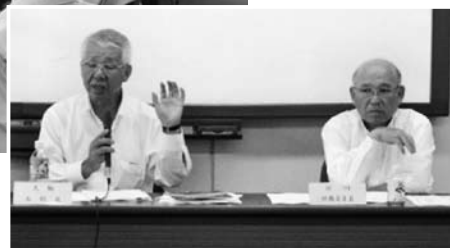
挨拶する大輪本部長(左)と宮川組織委員長