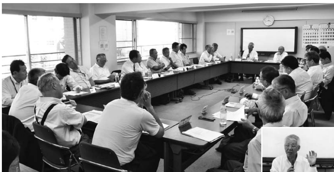
活発な意見交換が行われた合同委員会