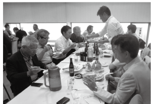
盛り上がる懇親パーティー