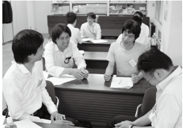
コミュニケーションスキル向上の実習

①求められるリーダー像、②リーダーシップとチームワーク、③コミュニケーションスキルUP!、④人材育成!こんな時はどうする?をテーマに、人づくりと職場作り、職場の課題解決について研修するとともに、他会員企業の社員との交流も活発に行い、有意義な1日間となりました。