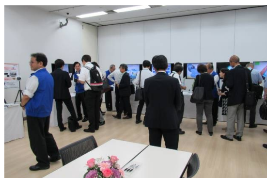
通信・電話ブース