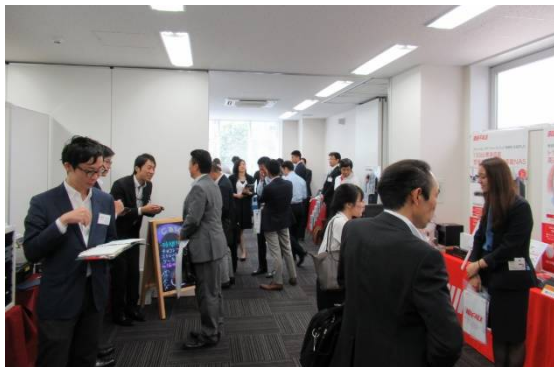
会場2階「働き方改革」「文教」「セキュリティ」「工事における業務効率化」ブース