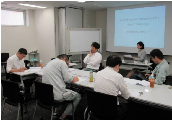
グループディスカッション模様