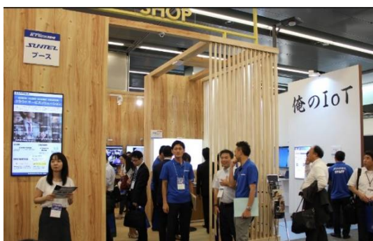
「Shop」 働き方改革を意識した店舗・オフィス向け空間