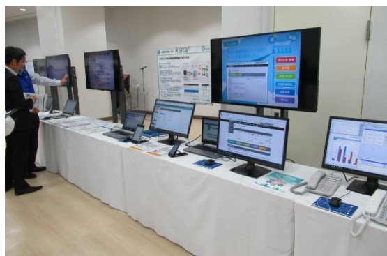
オリジナル製品ブース