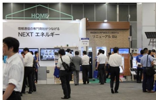
「Home」 ICTによる省エネルギーをテーマにした仮想住宅空間