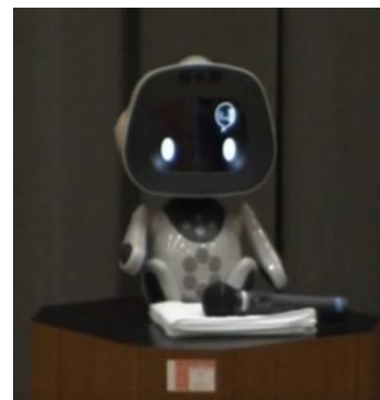
コミュニケーションロボット「Unibo」によるオープニングメッセージ