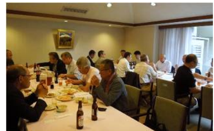
和やかな懇親会模様