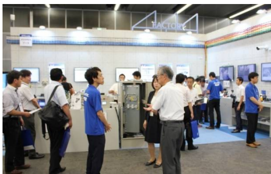
「Factory」 Industrial IoTでつながる製造現場