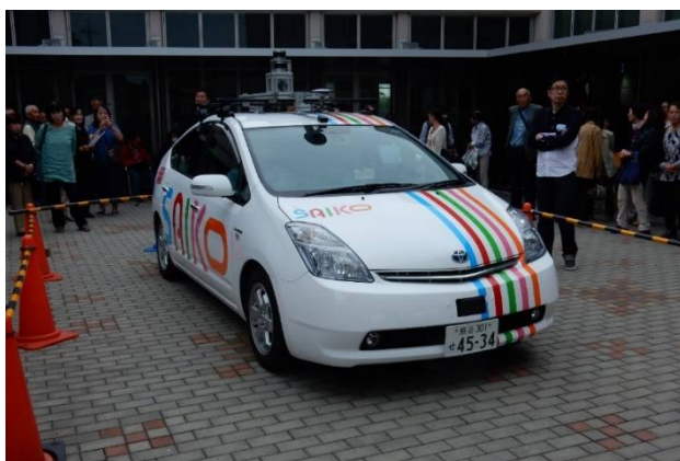
自動運転実証実験模様（トヨタプリウス改造車）