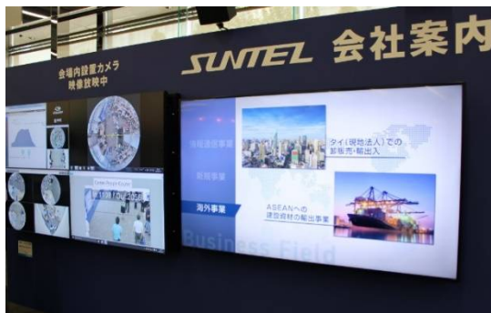
会場内設置カメラにて映像放映