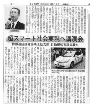
建設通信新聞 6月19日付に記事掲載