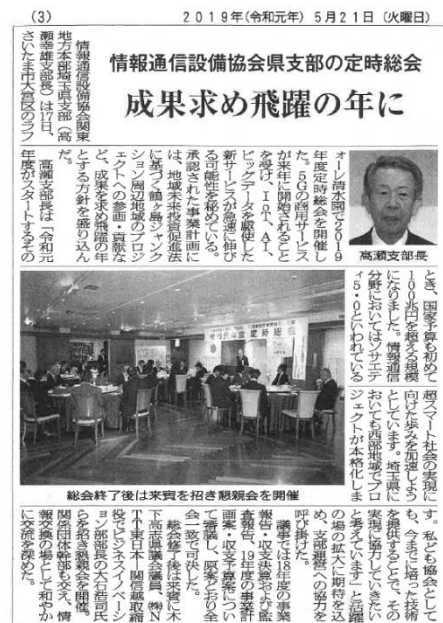
埼玉建設新聞 5月21日付に総会模様掲載