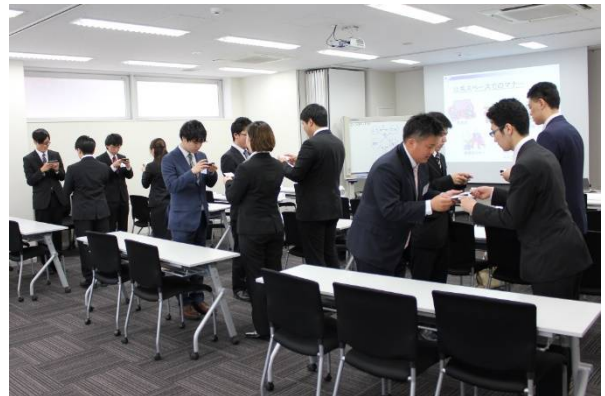
「ビジネスマナー」名刺交換模様