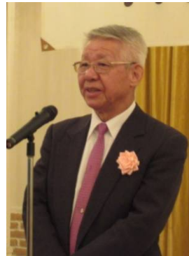
大輪理事長の挨拶