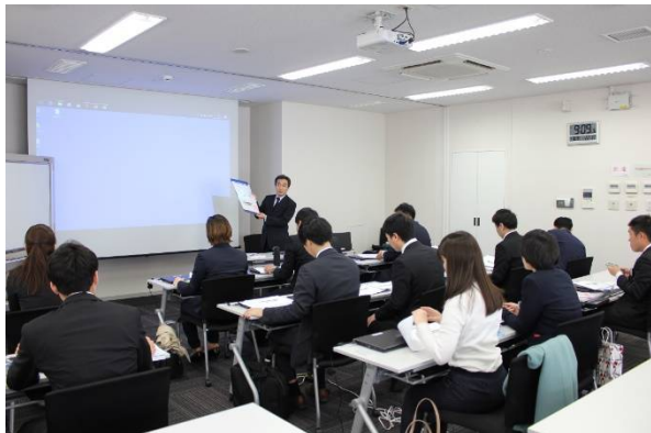
「電気通信の基礎」研修模様