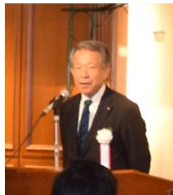
高瀬支部長の挨拶