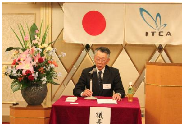
議長を務める今井本部長