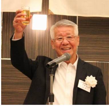
大輪理事長の乾杯ご発声