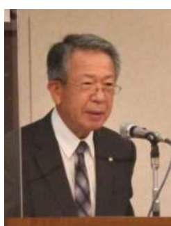
高瀬総務財務委員長