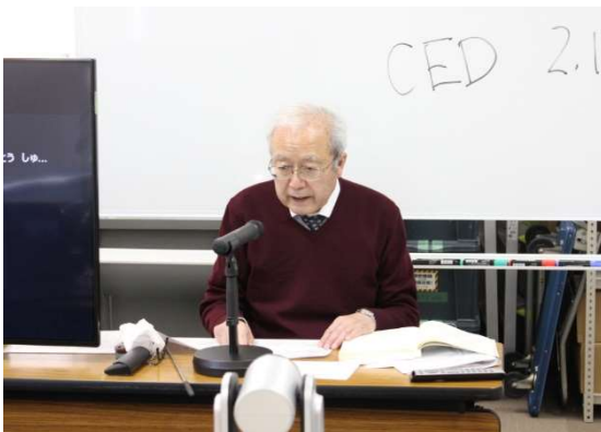
技術コース研修模様