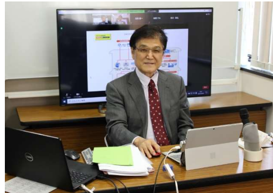
基礎コース研修模様

令和2年度の第2回工事担任者試験の電気通信国家試験センター全体(全国合計)の合格率は、AI・DD総合種が28.4%となっています。また、(一財)日本データ通信協会 電気通信国家試験センターのホームページに、平成30年度第2回からの全試験問題と解答が掲載されますので、今後の受験にお役立てください。