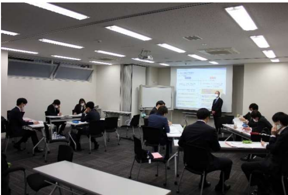
電話対応の練習模様