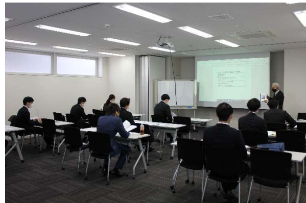
「電気通信の基礎」研修模様