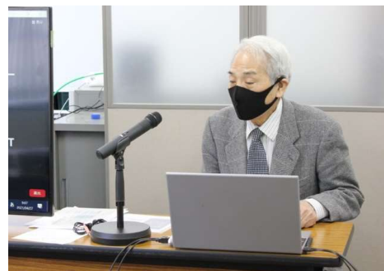
法規コース研修模様