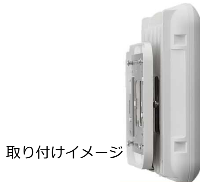
取り付けイメージ