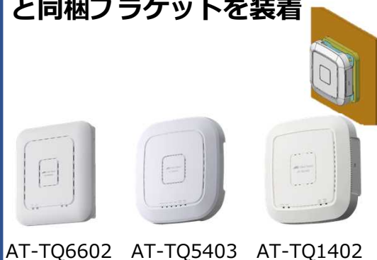
AT-TQ6602 AT-TQ5403 AT-TQ1402