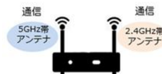
<一般的なアクセスポイント>