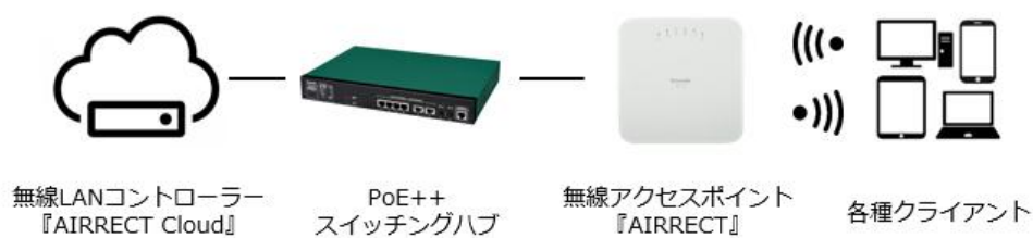
<ネットワーク接続イメージ>