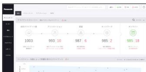
<接続状況の一括監視画面>