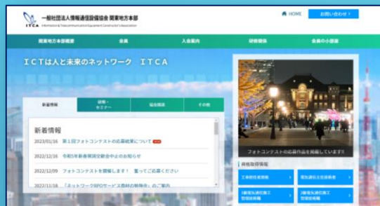
図1：第1回作品をフォトウィンドウで表示